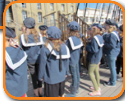
Les élèves de 4 e , 5 e et 6 e années de l'implantation de Vierset.